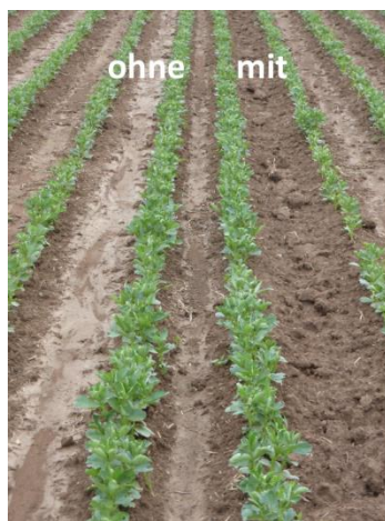
Abbildung 4: Arbeitsbild des Rollspurlockerer